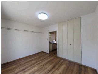
その他部屋・スペース